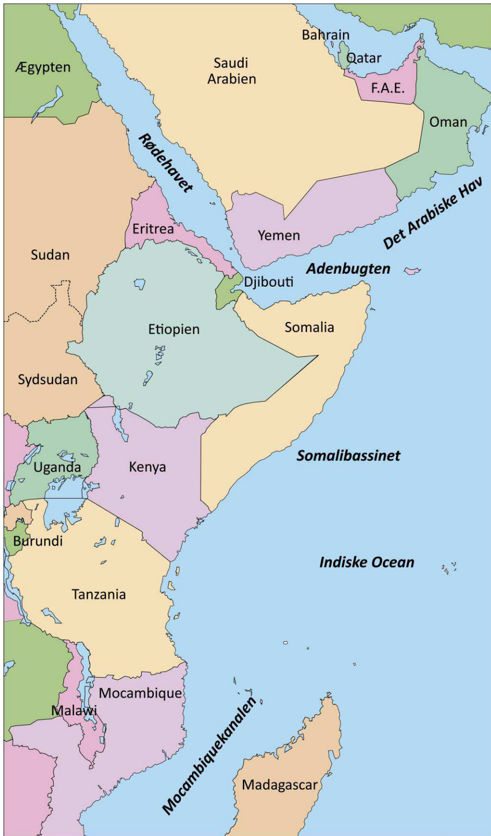
Det Indiske Ocean.